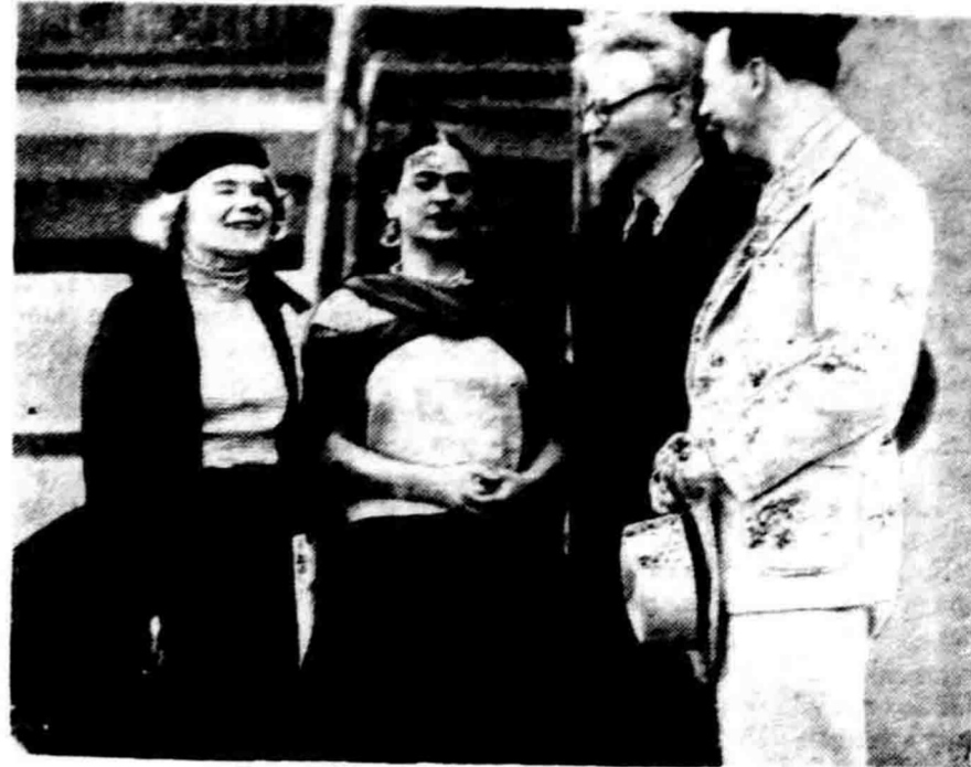
Leon Trotzky (jang memakai katja mata) dengan isterinja digambar sedatangnja di Mexico dengan didjempoei oleh kawan-kawan sefahamnja jang berada disana.

Mereka itoe boeat sementara waktoneja mendapatkan bantoean beberapa barang pakaian dan roemah pondokan, sedang sehari-harinja dapat rangsoem djoen tambakuan dan sirih. Apabila mereka itoe nanti soelah kenal dan faham kepada pekerdjaan 2 pertanian, maka kepada masing-masing orang itoe akan diberikan bantoean