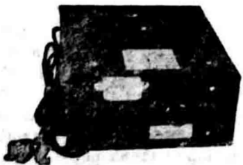
A. T. R. OMVORMER.

Goenakanlah Toean poenja Radio di segala saat dan tempat dengan pakai: